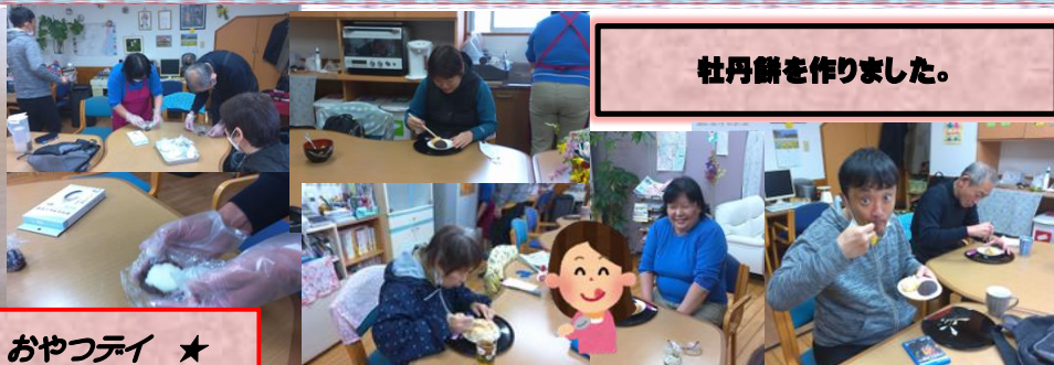
牡丹餅を作りました。