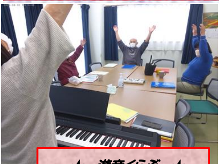
★ 遊音くらぶ ★