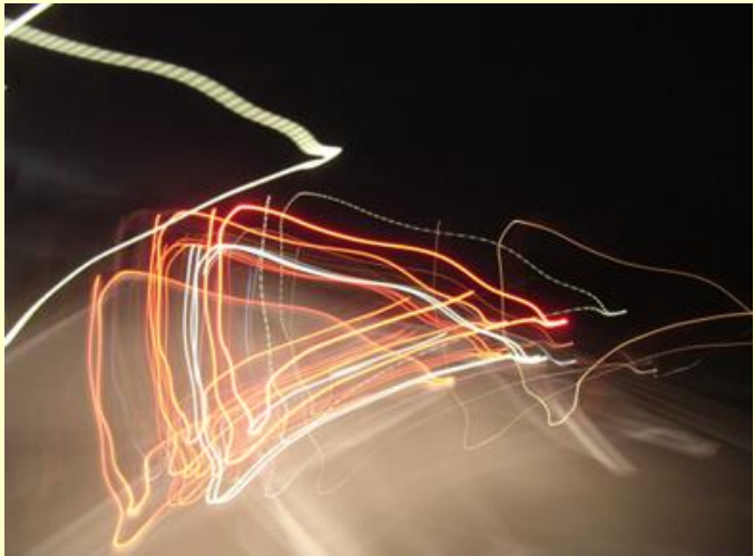
投稿者: 夢の船乗りさん 「Night fly 180」