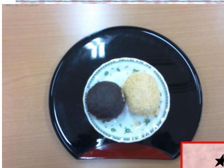
★ おやつタイム ★