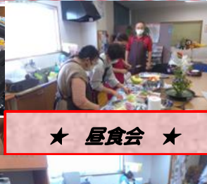
★ 昼食会 ★