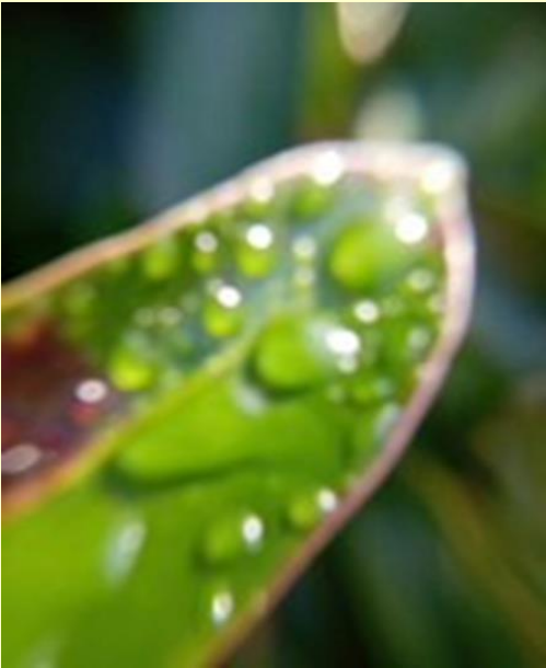
投稿者: 夢の船乗りさん 「Another Green World 1」